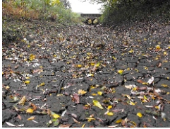
Hol az eső sem jár...

Jelenleg a Tócióról kialakult általános vélemény igen megosztott a lakosok körében függően attól, hogy a patak melyik szakasza érinti közvetlenül a lakó-, illetve életterületet.