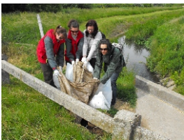
2012. évi Teszedd akció

A Tóció megbecsülésében tapasztalt fekete folt, hogy a lakosság a partszegélyt és a medret több szakaszon személtlerakó helynek használja az emberi érdeklődés és igényesség peremére szorítva ezzel Debrecen felszíni vízfolyását.