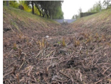
Tóció patak 2012. évben

A Tócióról általánosságban elmondható, hogy vízjárása erősen időjárásfüggő. A változó vízszint jellemzően befolyásolja a víz minőségét, kisebb vízállás mellett a vízben kedvezőtlen, akár bűzhatással járó biológiai folyamatok mehetnek végbe, ami a lakosok életminőségére is hatással van. Mindazonáltal a Tóció medrét az önkormányzatnak sikerült évek óta olyan állapotban megtartani, hogy az elmúlt időszak jelentős csapadékmennyiséget hozó éveiben a város nyugati részén belvízelöntések nem jelentkeztek, a vizek elvezetése megoldott volt.